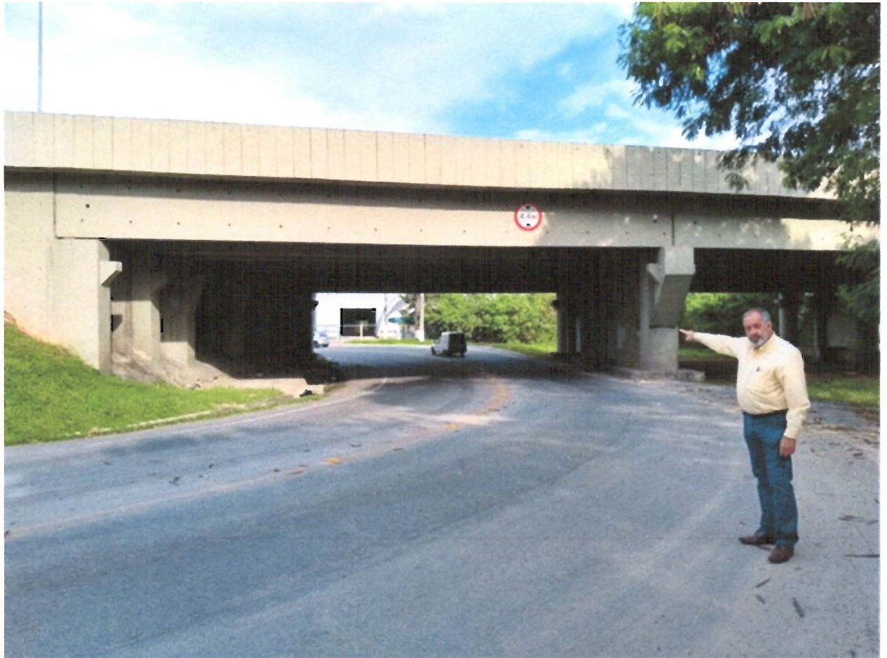
FOTO: Viaduto na altura do km 161 da Rodovia Presidente Dutra, próximo à empresa Basf, em Jacareí.